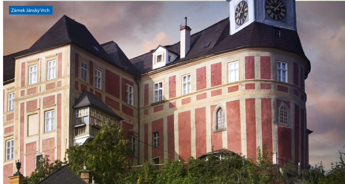
Zámek Jánský Vrch

Květen, červen: úterý, středa, čtvrtek: 9:00 – 11:00, 13:00 – 15:00, pondělí, pátek zavřeno, červenec, srpen: úterý, čtvrtek: 9:00 – 11:00, 13:00 – 15:00, pondělí, středa, pátek zavřeno, září: úterý: 9:00 – 11:00, 13:00 – 15:00, pondělí, středa, čtvrtek, pátek zavřeno